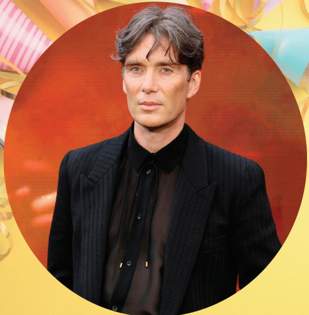
CILLIAN MURPHY (Actor)